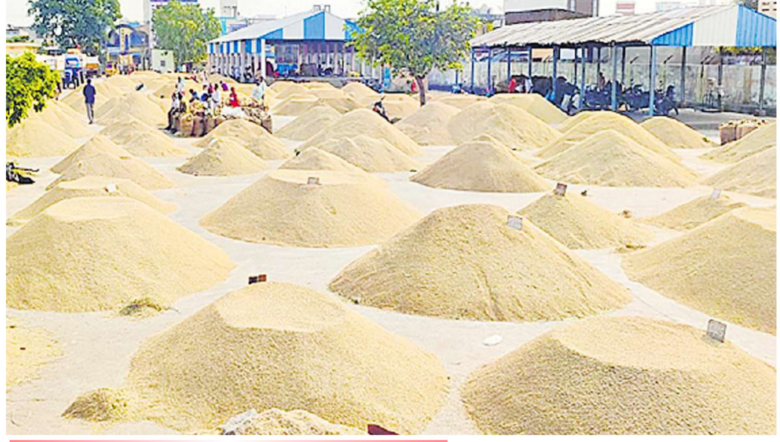
ఇంకా మందకొడిగానే కొనుగోళ్లు..

వరి సాగు, ధాన్యం ఉత్పత్తిలో తెలంగాణ దేశంలో అగ్రగామిగా నిలుస్తుంది. పంజాబ్ రాష్ట్రాన్ని తలదాటి తెలంగాణ రైతాంగం చరిత్ర సృష్టించింది. గత పదేళ్లుగా వానకాలం, యాసంగి సీజన్ లో వరి ఉత్పత్తిలో నంబర్ వన్ గా నిలుస్తున్నప్పటికీ రైతాంగానికి కష్టాలు దూరం కావడం లేదు. గడిచిన రెండున్నరేళ్లుగా ధాన్యం సేకరణలో ప్రభుత్వం అనుకున్న స్థాయిలో సక్సెస్ కాలేకపోతుంది. వరి సాగు విస్తీర్ణం ఎంతో తెలిసినప్పుడు ధాన్యం కొనుగోళ్ల కోసం ముందస్తుగా ఏర్పాట్లు చేయకపోవడం సమస్యగా మారుతుంది. ఈసారి యాసంగిలో రాష్ట్ర వ్యాప్తంగా 53 లక్షల ఎకరాల్లో వరి సాగు జరిగింది. దాదాపు 90 లక్షల మెట్రిక్ టన్నుల ధాన్యం సేకరణ చేయాల్సి ఉంటుంది. ప్రతిసారి యాసంగిలో సాగు పెరగడం, ఉత్పత్తి పెరగడం స్పష్టంగా కనిపిస్తుంది. అందుకు అనుగుణంగా సేకరణ చేయాల్సి ఉంటుంది. దీనికోసం యంత్రాంగం ముందస్తుగా ఏర్పాట్లు చేయాలి. కానీ ధాన్యం సేకరణలో ప్రభుత్వ నిర్లక్ష్యం స్పష్టంగా కనిపిస్తోంది. ప్రతి సీజన్ లో ఆలస్యంగా కొనుగోళ్లు చేయడం, సకాలంలో కొనుగోలు కేంద్రాల ప్రారంభించకపోవడం రైతాంగానికి తీవ్ర ఇబ్బంది కలుగుతోంది. దీంతో కొనుగోళ్లలో జాప్యంపై రైతాంగం రోడ్లకడం సంప్రదాయంగా మారిపోయింది. అప్పటి వరకు ప్రభుత్వం ప్రక్రియ వేగవంతం చేయడం లేదనే అపవాదు మూటగట్టుకోవాల్సి వస్తుంది. దీనికి తోడు ఆంధ్ర కార్య యంత్రాంగం సరైన ఏర్పాట్లు చేయకపోవడం, అవసరాలను ప్రభుత్వానికి నివేదించకపోవడం మరో కారణం. నూతన వరి ధాన్యం సేకరణ విధానం కూడా రైతులకు ఇబ్బందిగా మారింది. వెంటనే కట్టు తెరిచిన ప్రభుత్వం మళ్ళీ పాత పద్ధతిలోనే సేకరణ చేపట్టడంతో ఊరట కలిగింది. సేకరణ దశకు ముందే నూతన విధానంపై స్పష్టమైన అవగాహన రైతులకు కల్పించాల్సిన అధికారులు అసలు సమయానికి తెర లేపారు. దీంతో వ్యవహారం బెదిసికొట్టింది.